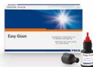
REF 1016 Флакон 5 мл, принадлежности